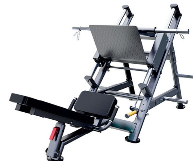
F-N49 45°倒蹬训练器 F-N49 45° Leg Press

占地面积/Dimension: 1260X1260X1550mm 毛重/净重 G.W/N.W: 160kg/152kg