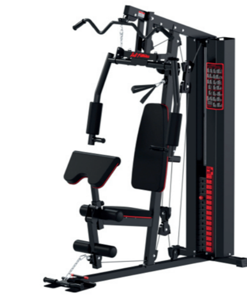
WT-H18A 单人站综合训练器 Home Gym 1 Station

占地面积 / Dimension: 1500×995×2020mm 毛重 / 净重 G.W/N.W: 88kg/84kg