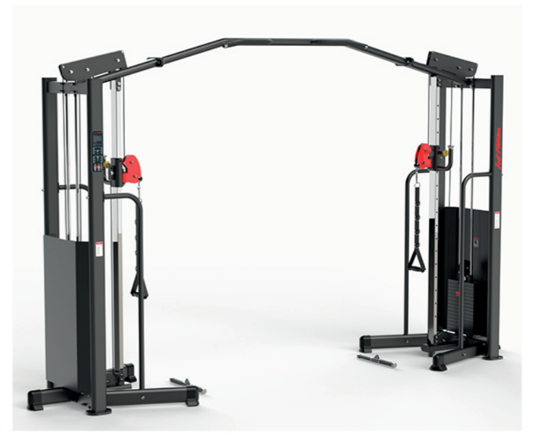
F-A06S 大飞鸟训练器 Cable Crossover

占地面积/Dimension: 970×1360×1526mm 毛重/净重 G.W/N.W: 153kg/145kg