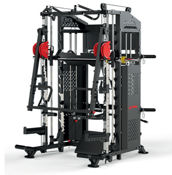
WT-X05 多功能史密斯机 Multi Function Smith Machine

占地面积 / Dimension: 2260 × 1620 × 2160mm 毛重 / 净重 G.W/N.W: 336kg/320kg