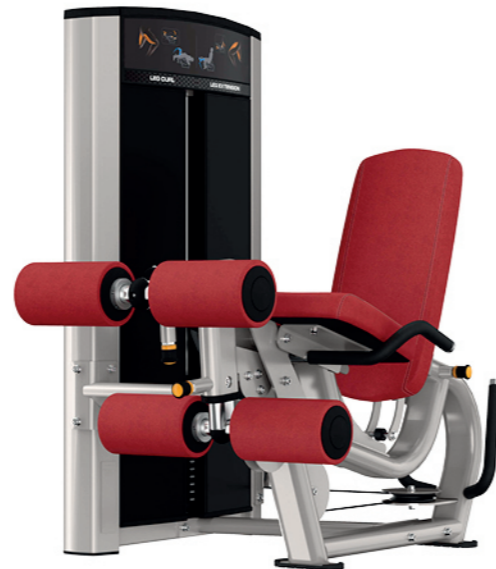
F02A 腿部伸展 / 屈腿训练器 Leg Extension / Leg Curl

占地面积 / Dimension: 1850x1020x1350mm 毛重 / 净重 G.W/N.W: 197kg/189kg