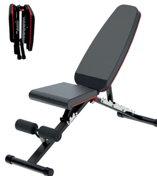
WT-B99 免安装哑铃凳 Adjustable Dumbbell Bench

占地面积 / Dimension: 1670×770×870mm 毛重 / 净重 G.W/N.W: 24kg/22kg