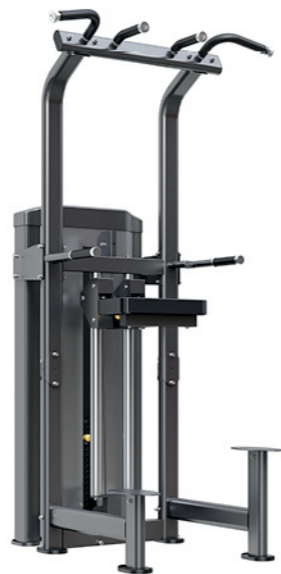
F-N14 上肢屈伸训练器 Chin/Dip Assist

占地面积/Dimension: 1650X1600X1550mm 毛重/净重 G.W/N.W: 186kg/176kg