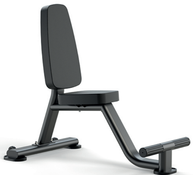
F-A61S 推肩椅 Utility Bench

占地面积 / Dimension: 1130×655×990mm 毛重 / 净重 G.W/N.W: 21kg/19kg