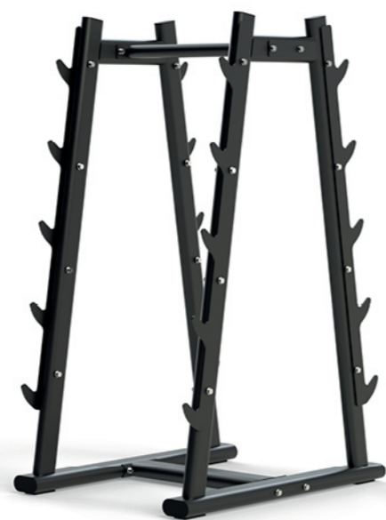
F-A62S 杠铃架 Barbell Rack

占地面积 / Dimension: 1130×655×990mm 毛重 / 净重 G.W/N.W: 21kg/19kg