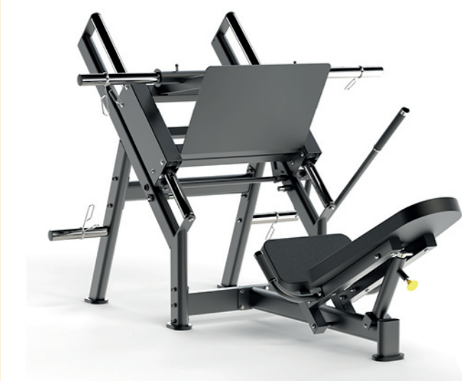
F-A49S 倒蹬训练器 45° Leg Press

占地面积/Dimension: 1820×1580×1250mm 毛重/净重 G.W/N.W: 50kg/47kg