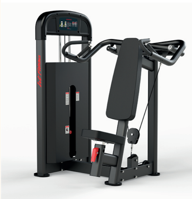
F-A11S 坐姿推肩训练器 Seated Shoulder Press

占地面积/Dimension: 950×1310×1526mm 毛重/净重 G.W/N.W: 147kg/139kg