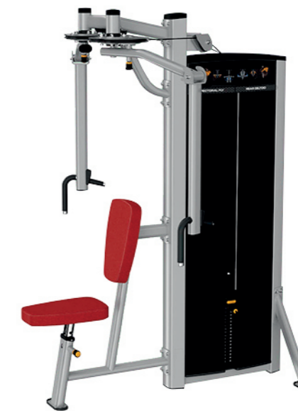
F11 肩部推举训练器 Shoulder Press

占地面积 / Dimension: 1540x1400x1350mm 毛重 / 净重 G.W/N.W: 219kg/211kg