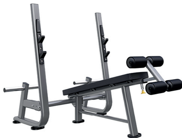
F-N51 下斜举重床 Decline Weight Bench

占地面积 / Dimension: 1700x1580x1460mm 毛重 / 净重 G.W/N.W: 65kg/62kg