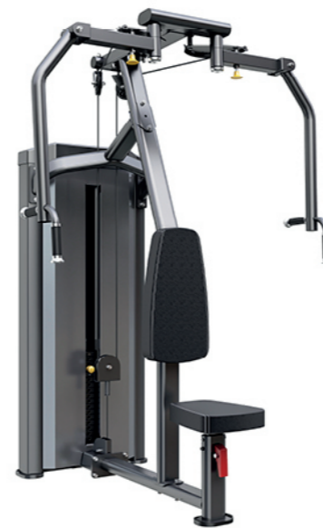
F-N17 直臂蝴蝶训练器 Pec Fly/Rear Delt

占地面积/Dimension: 1200x1200x2240mm 毛重/净重 G.W/N.W: 209kg/199kg