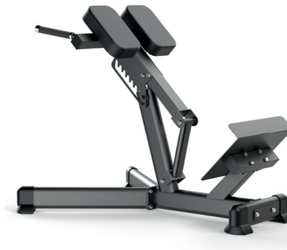
F-A59S 罗马椅 Roman Chair

占地面积 / Dimension: 1620×660×1300mm 毛重 / 净重 G.W/N.W: 32kg/30kg