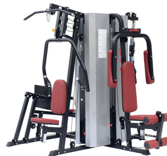
WT-H95/H95A 五人站综合训练器 Multi Gym 5 Station 占地面积 / Dimension: 2400×2400×2050mm 毛重 / 净重 G.W/N.W: 385kg/375kg