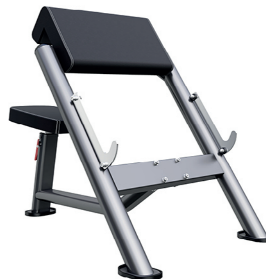
F-N55 二头肌架 Scott Bench

占地面积 / Dimension: 1310x655x430mm 毛重 / 净重 G.W/N.W: 21kg/18kg