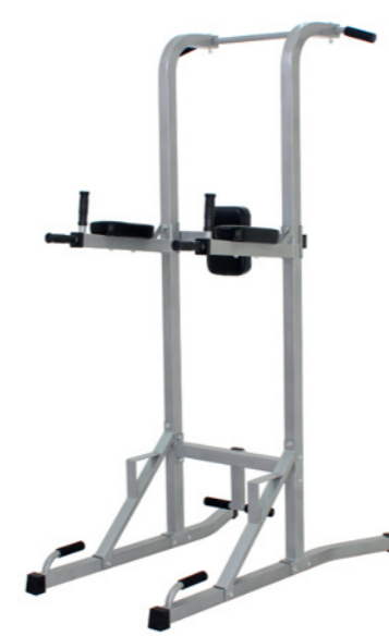
WT-H06 单杠提膝训练器 Dip Chin AB

占地面积 / Dimension: 1080×750×1450mm 毛重 / 净重 G.W/N.W: 24kg/22kg