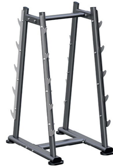
F-N63 杠铃片架 Barbell Plate Tree

占地面积 / Dimension: 1120x870x970mm 毛重 / 净重 G.W/N.W: 32kg/29kg