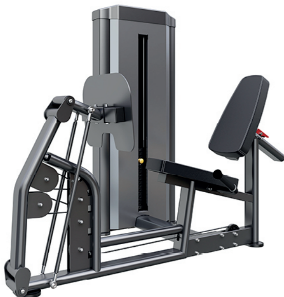
F-N15 坐姿蹬腿训练器 Seated Leg Press

占地面积/Dimension: 1550X1220X2140mm 毛重/净重 G.W/N.W: 170kg/162kg