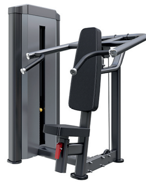
F-N11 坐姿推肩训练器 Seated Shoulder Press

占地面积/Dimension: 1100×1100×1550mm 毛重/净重 G.W/N.W: 168kg/160kg