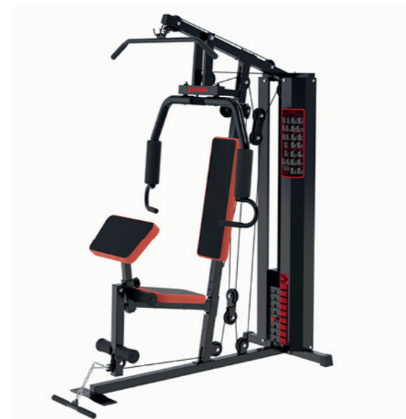
WT-H88 单人站综合训练器 Home Gym 1 Station

占地面积 / Dimension: 1850×1030×2080mm 毛重 / 净重 G.W/N.W: 139kg/135kg