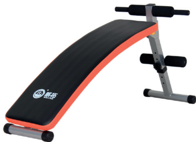
WT-B28 腹肌板 Sit Up Bench

占地面积 / Dimension: 1420×590×1250mm 毛重 / 净重 G.W/N.W: 17kg/15kg