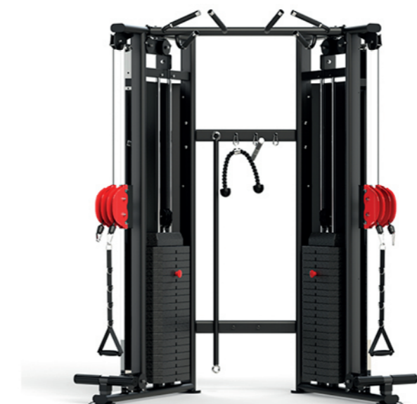
F-A88A 小飞鸟训练器 Multi Function Trainer

占地面积 / Dimension: 1700×1120×2200mm 毛重 / 净重 G.W/N.W: 48kg/46kg