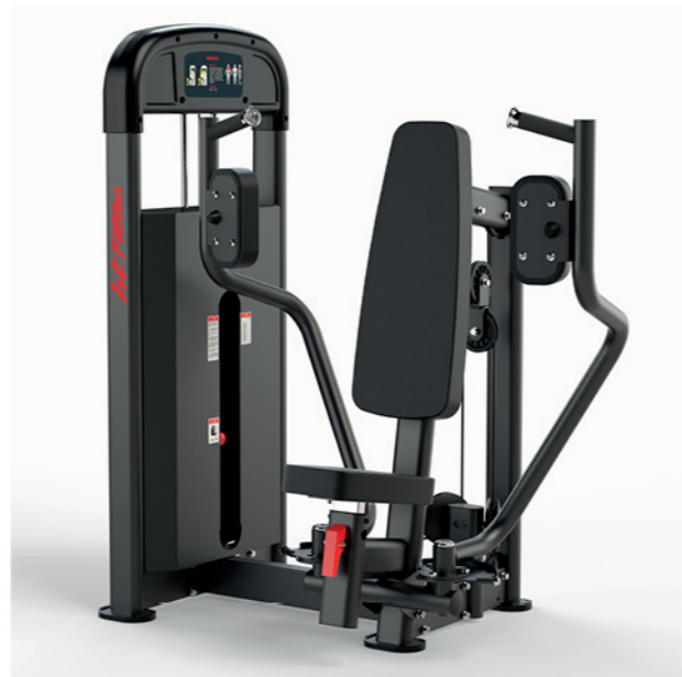
F-A04S 蝴蝶扩胸训练器 Butterfly

占地面积/Dimension: 1160×1370×1526mm 毛重/净重 G.W/N.W: 133kg/125kg