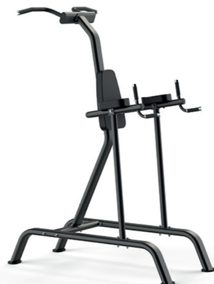
F-A66S 单杠提膝训练器 Dip Chin AB

占地面积 / Dimension: 680×650×1250mm 毛重 / 净重 G.W/N.W: 17kg/15kg