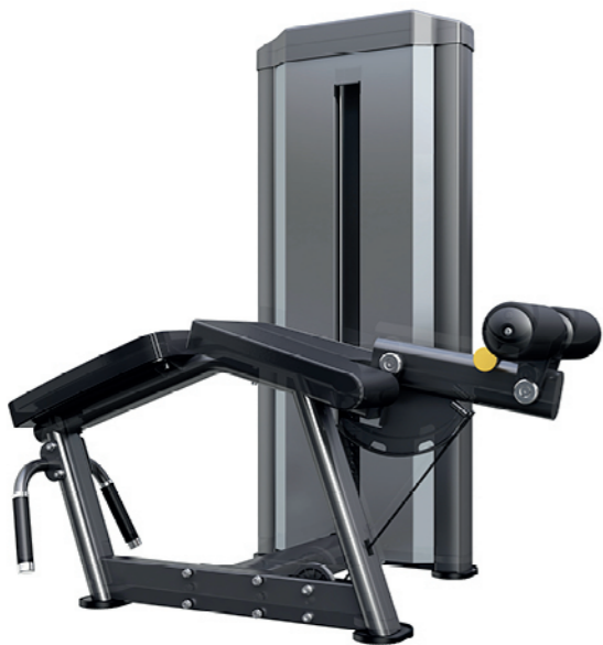
F-N03 卧式屈腿训练器 Prone Leg Curl

占地面积/Dimension: 3750×1120×2300mm 毛重/净重 G.W/N.W: 362kg/346kg