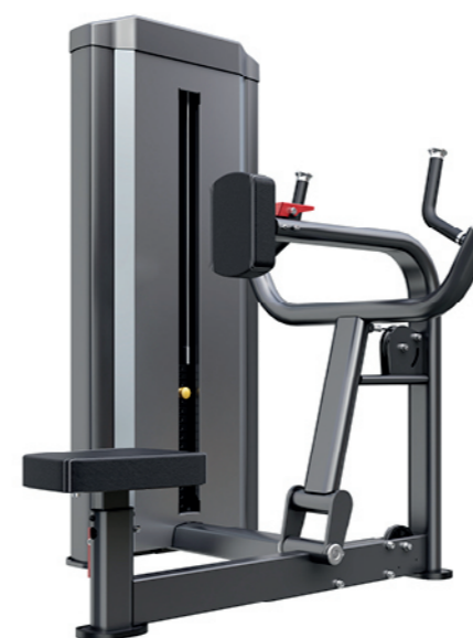
F-N22 坐姿划船训练器 Seated Rowing

占地面积/Dimension: 1050X1160X1550mm 毛重/净重 G.W/N.W: 159kg/151kg