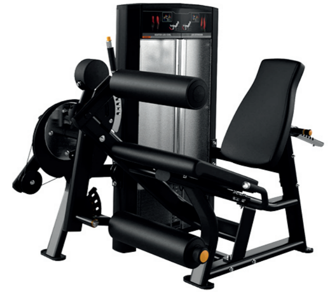
F03A 坐式腿部伸展 / 屈腿训练器 Seated Leg Extension / Curl

占地面积 / Dimension: 1640x1090x1350mm 毛重 / 净重 G.W/N.W: 183kg/175kg