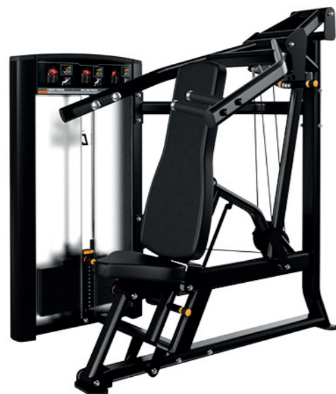
F21 多功能推举训练器 Seated Multi Press

占地面积/Dimension: 1400x640x1140mm 毛重/净重 G.W/N.W: 33kg/30kg