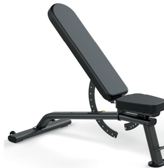
F-A57S 可调哑铃练习凳 Adjustable Dumbbell Bench

占地面积 / Dimension: 2000×650×670mm 毛重 / 净重 G.W/N.W: 46kg/42kg