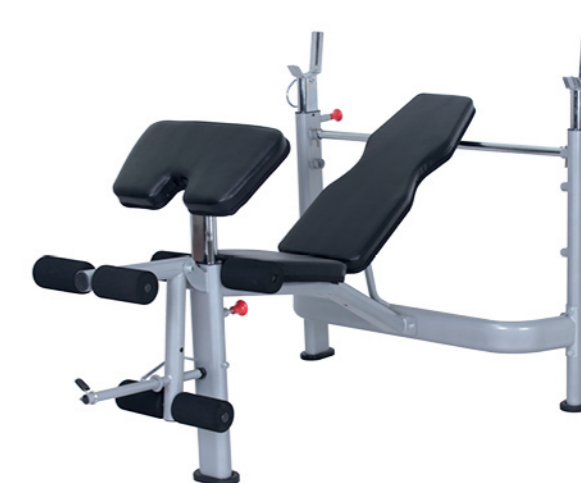
WT-B68 举重床 Weight Bench

占地面积 / Dimension: 1760×1100×1200mm 毛重 / 净重 G.W/N.W: 26kg/23kg