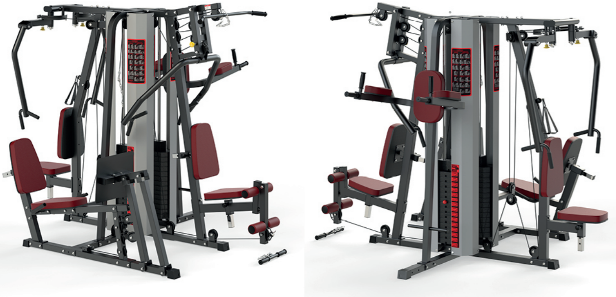
WT-H99C 五人站综合训练器 Multi Gym 5 Station

占地面积 / Dimension: 2400×2400×2050mm 毛重 / 净重 G.W/N.W: 310kg/300kg