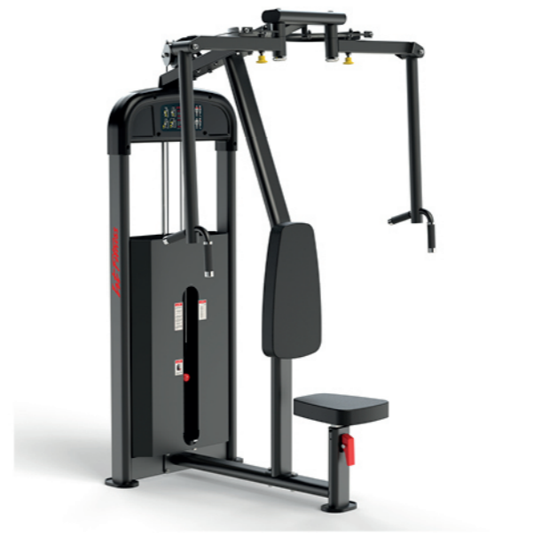
F-A17S 直臂蝴蝶训练器 Pec Fly/Rear Delt

占地面积/Dimension: 1110×1140×2280mm 毛重/净重 G.W/N.W: 182kg/175kg