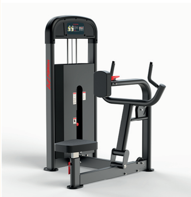
F-A22S 坐姿划船训练器 Seated Rowing

占地面积/Dimension: 1290×1250×1526mm 毛重/净重 G.W/N.W: 145kg/139kg