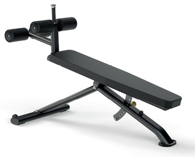
F-A56S 可调腹肌板 Adjustable AB Bench

占地面积 / Dimension: 930×760×910mm 毛重 / 净重 G.W/N.W: 27kg/25kg