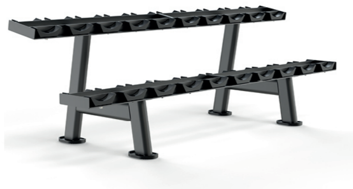
F-A54S 十付哑铃架 Dumbbell Rack(10 Pairs)

占地面积 / Dimension: 1280×735×850mm 毛重 / 净重 G.W/N.W: 40kg/38kg