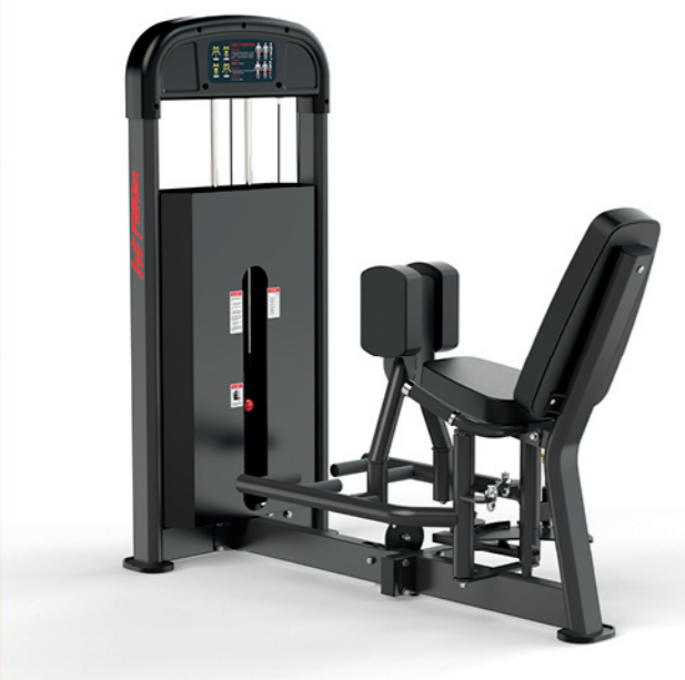
F-A13S 大腿内外侧训练器 Hip Adductor/Abductor

占地面积/Dimension: 910×1150×1526mm 毛重/净重 G.W/N.W: 155kg/147kg