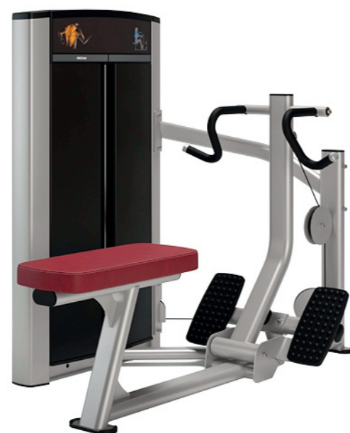
F22 坐式划船训练器 Seated Rowing

占地面积/Dimension: 1730x1370x1570mm 毛重/净重 G.W/N.W: 245kg/236kg