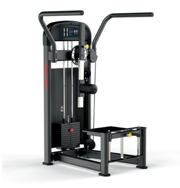
F-A12S 髋部训练器 Multi Hip

占地面积/Dimension: 950×1310×1526mm 毛重/净重 G.W/N.W: 147kg/139kg