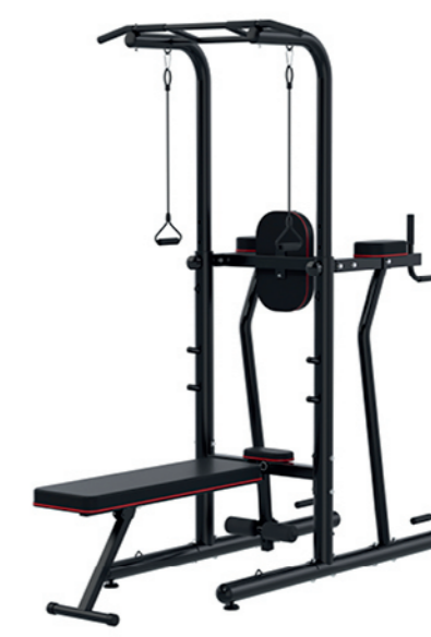
WT-H06A 单双杠综合训练器 Dip Chin AB

占地面积 / Dimension: 1300×1100×2130mm 毛重 / 净重 G.W/N.W: 32kg/30kg