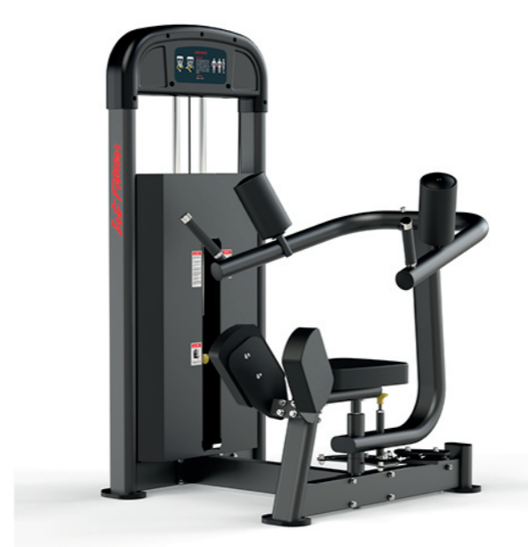
F-A08S 扭腰训练器 Rotary Torso

占地面积/Dimension: 950×1400×1526mm 毛重/净重 G.W/N.W: 161kg/153kg