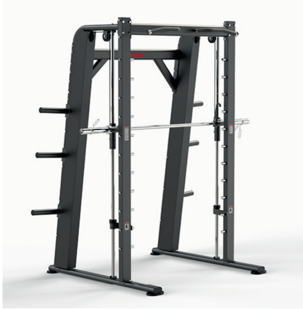
F-A01S 史密斯训练机 Smith Machine

占地面积/Dimension: 2080X1440X2300MM 毛重/净重 G.W/N.W: 183kg/176kg