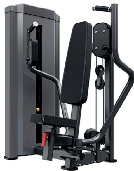
F-N04 蝴蝶扩胸训练器 Butterfly

占地面积/Dimension: 1400×1100×1550mm 毛重/净重 G.W/N.W: 150kg/143kg