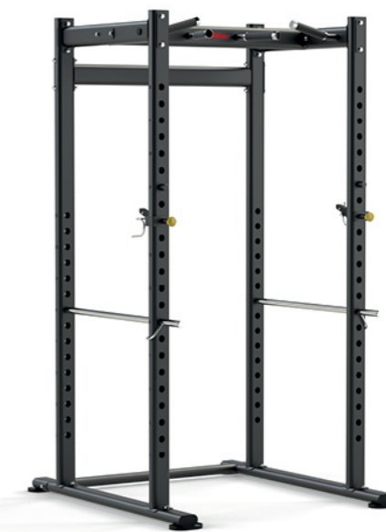
F-A58S 深蹲架 Power Rack

占地面积 / Dimension: 1420×600×1380mm 毛重 / 净重 G.W/N.W: 28kg/26kg