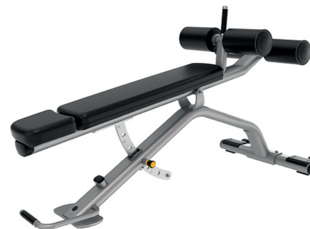
F56 可调式下斜训练椅 Adjustable Decline Bench

占地面积/Dimension: 2000x890x2160mm 毛重/净重 G.W/N.W: 205kg/197kg