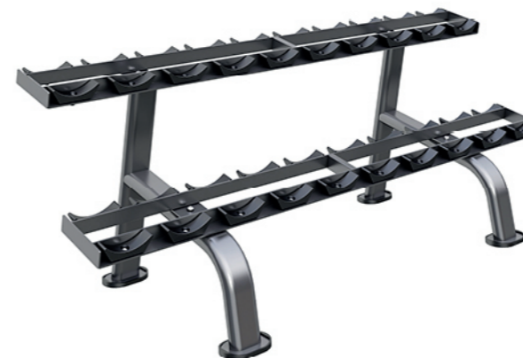
F-N54 十付哑铃架 Dumbbell Rack(10 Pairs)

占地面积 / Dimension: 1900x1580x1290mm 毛重 / 净重 G.W/N.W: 65kg/62kg