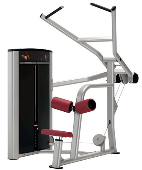
F07 高拉背肌训练器 Lat Pulldown

占地面积 / Dimension: 1120x1290x1350mm 毛重 / 净重 G.W/N.W: 210kg/202kg