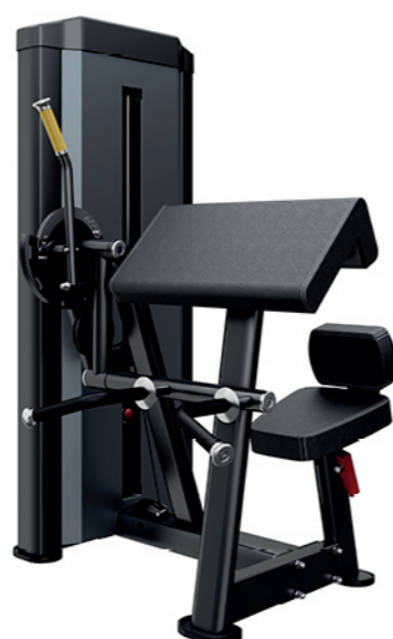
F-N16 上臂屈伸训练器 Triceps Extension/Biceps Curl

占地面积/Dimension: 1850X1150X1550mm 毛重/净重 G.W/N.W: 198kg/187kg