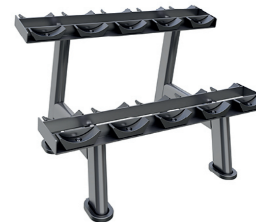
F-N54A 五付哑铃架 Dumbbell Rack(5 Pairs)

占地面积 / Dimension: 1980x780x780mm 毛重 / 净重 G.W/N.W: 49kg/45kg