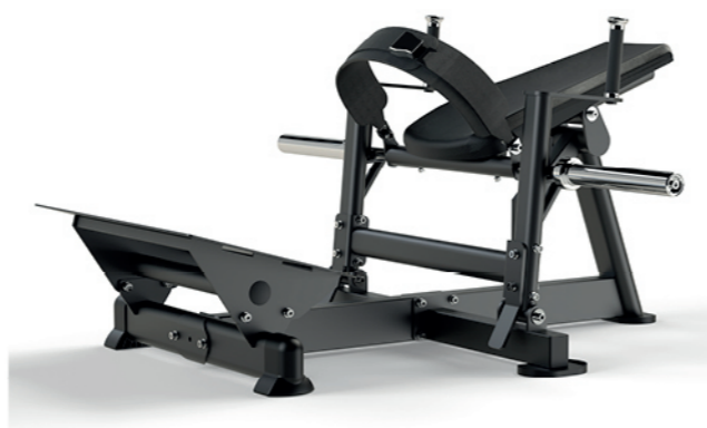
F-A47S 臀推训练器 Hip Thrust

占地面积/Dimension: 1290×1250×1526mm 毛重/净重 G.W/N.W: 145kg/139kg