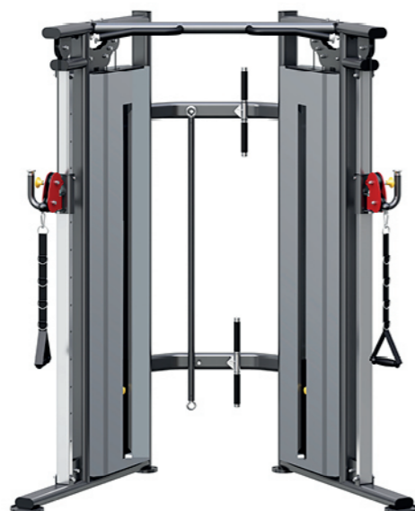
F-N88 小飞鸟训练器 Functional Trainer

占地面积 / Dimension: 1865x1540x1730mm 毛重 / 净重 G.W/N.W: 113kg/109kg