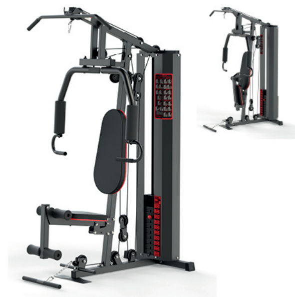
WT-H88Z 单人站综合训练器 Home Gym 1 Station

占地面积 / Dimension: 1600×890×2060mm 毛重 / 净重 G.W/N.W: 115kg/111kg