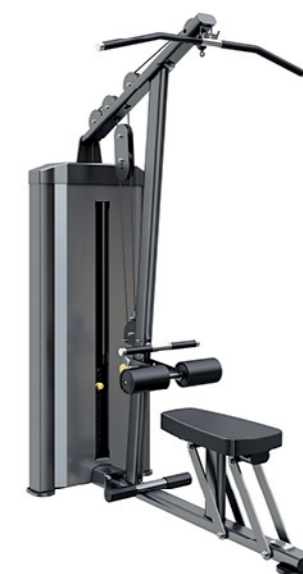
F-N19 高低拉训练器 Lat Pulldown/Mid Row

占地面积/Dimension: 1320X1500X1990mm 毛重/净重 G.W/N.W: 179kg/168kg