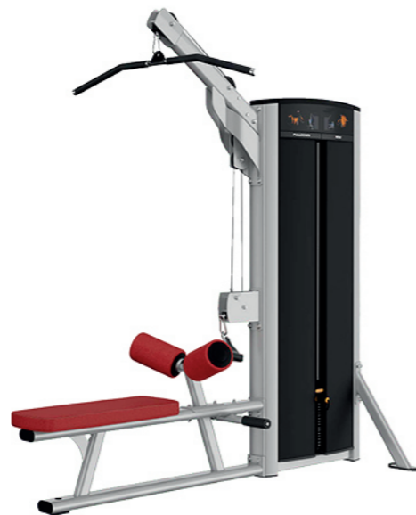
F19 高拉 / 划船训练器 Lat Pulldown/Low Row

占地面积/Dimension: 1450x1040x1350mm 毛重/净重 G.W/N.W: 172kg/164kg