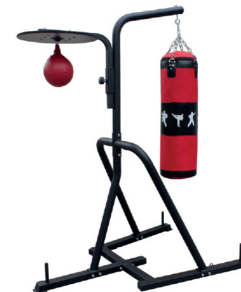
WT-Q02 豪华沙包架 Multi-functional Boxing Stand

占地面积 / Dimension: 1420×410×1250mm 毛重 / 净重 G.W/N.W: 15kg/13kg