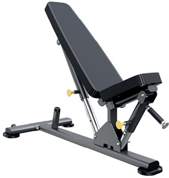
F-N57 可调哑铃练习凳 Adjustable Dumbbell Bench

占地面积 / Dimension: 1450X660X1320mm 毛重 / 净重 G.W/N.W: 32kg/29kg