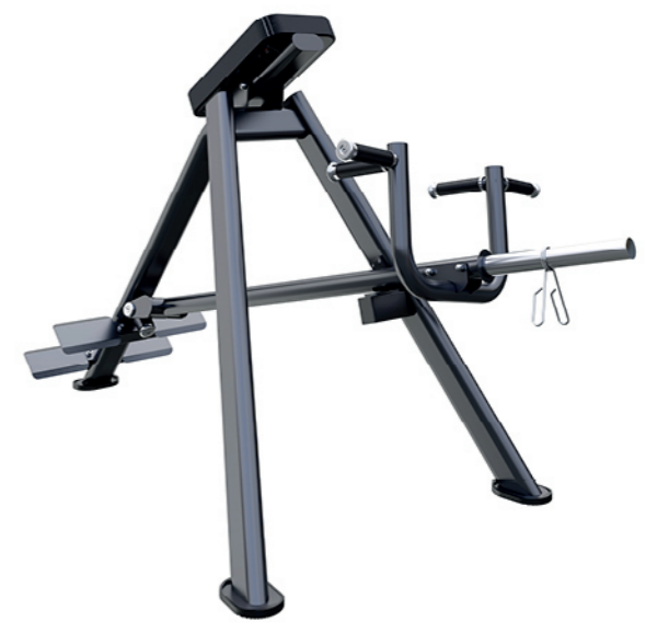
F-N64 T形划船器 T-Bar Row Machine

占地面积 / Dimension: 1120X655X1140mm 毛重 / 净重 G.W/N.W: 30kg/28kg