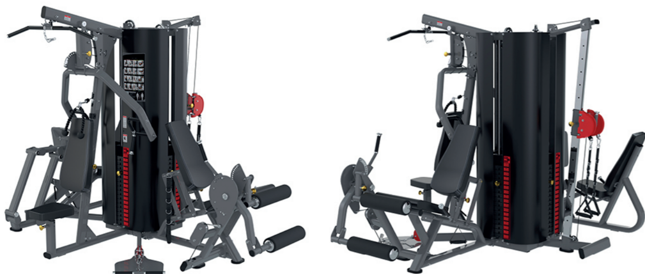
F-G5 五人站综合训练器 Multi Gym 5 Station

占地面积 / Dimension: 1650 × 1240 × 1980mm 毛重 / 净重 G.W/N.W: 186kg/176kg