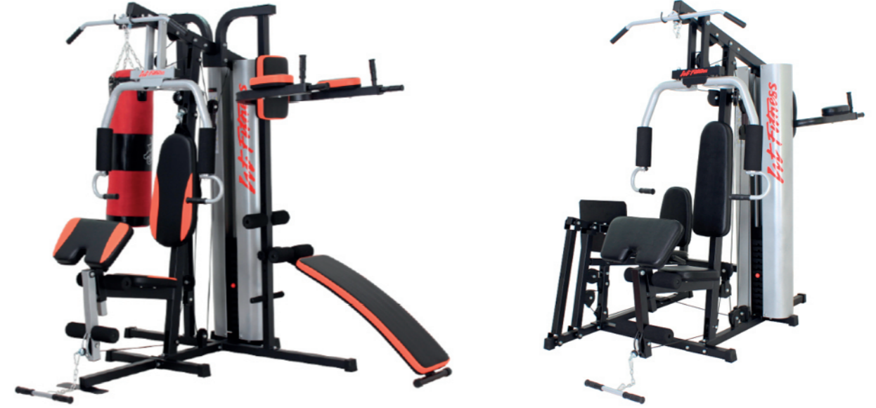
WT-H83 三人站综合训练器 Multi Gym 3 Station

占地面积 / Dimension: 2400×2400×2050mm 毛重 / 净重 G.W/N.W: 310kg/300kg