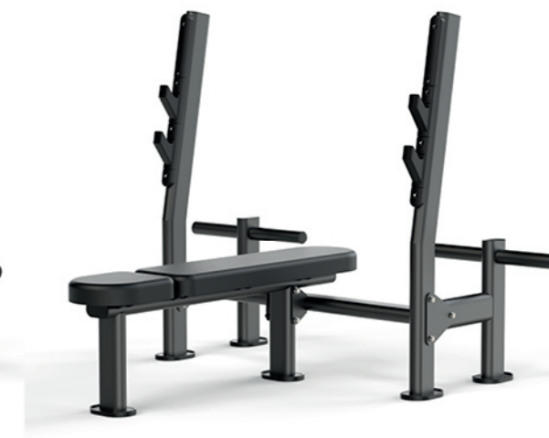
F-A52S 平卧推举重床 Olympic Flat Weight Bench

占地面积/Dimension: 1820×1580×1250mm 毛重/净重 G.W/N.W: 57kg/54kg