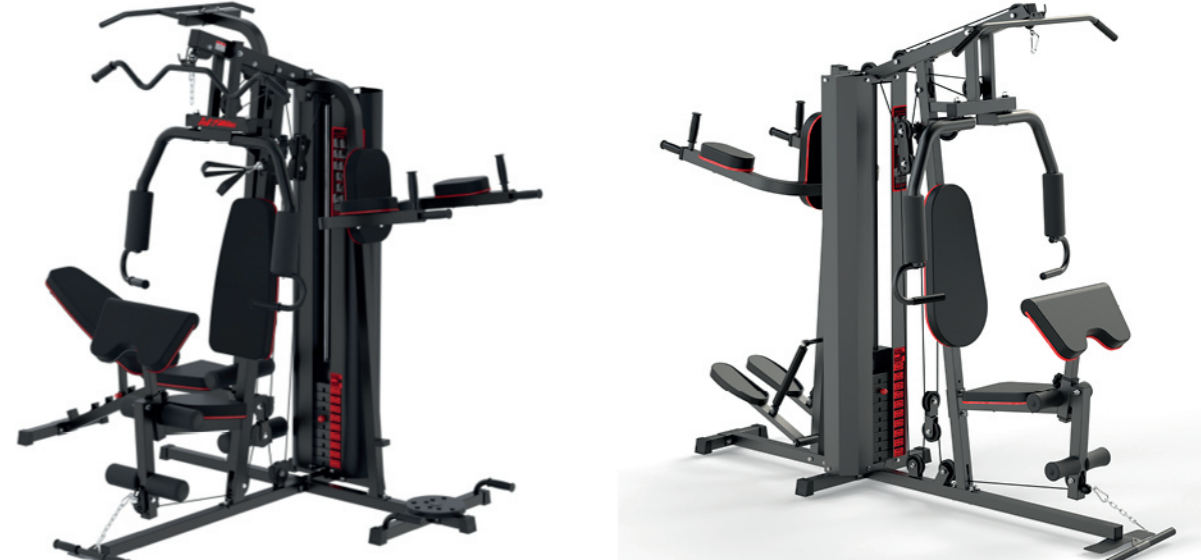
WT-H13/H13A 三人站综合训练器 Multi Gym 3 Station

占地面积 / Dimension: 2400×2400×2050mm 毛重 / 净重 G.W/N.W: 295kg/285kg