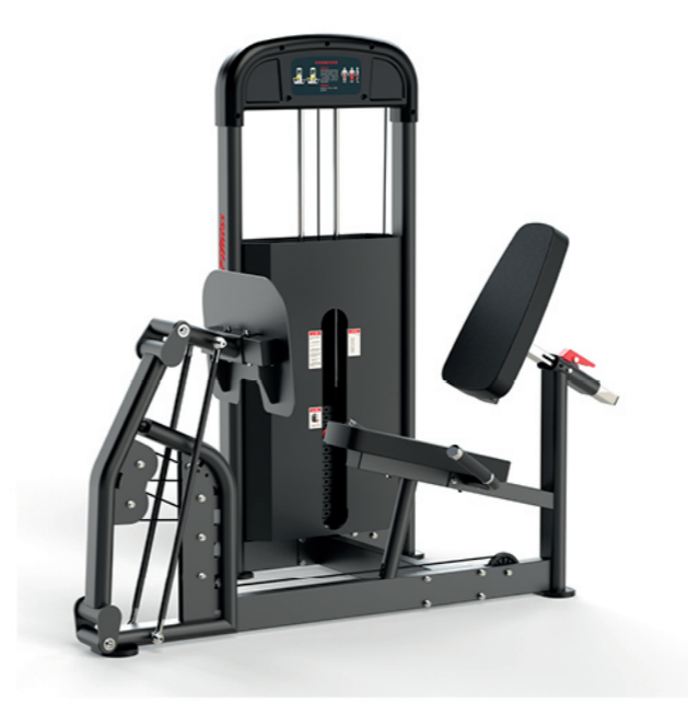
F-A15S 坐姿蹬腿训练器 Seated Leg Press

占地面积/Dimension: 1200×1600×1650mm 毛重/净重 G.W/N.W: 162kg/155kg