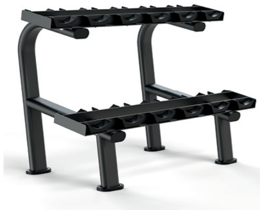
F-A54B 六付哑铃架 Dumbbell Rack(6 Pairs)

占地面积 / Dimension: 1280×735×850mm 毛重 / 净重 G.W/N.W: 40kg/38kg