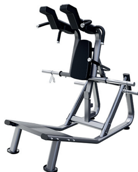
F-N69 哈克深蹲训练器 Hack Squat Machine

占地面积 / Dimension: 1450X950X1060mm 毛重 / 净重 G.W/N.W: 48kg/45kg