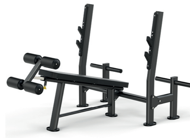
F-A51S 下斜推举重床 Decline Weight Bench

占地面积/Dimension: 1475×1520×750mm 毛重/净重 G.W/N.W: 76kg/73kg