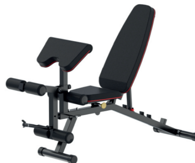
WT-B10 多功能小飞鸟 Adjustable Dumbbell Bench

占地面积 / Dimension: 1580×630×740mm 毛重 / 净重 G.W/N.W: 14kg/12kg