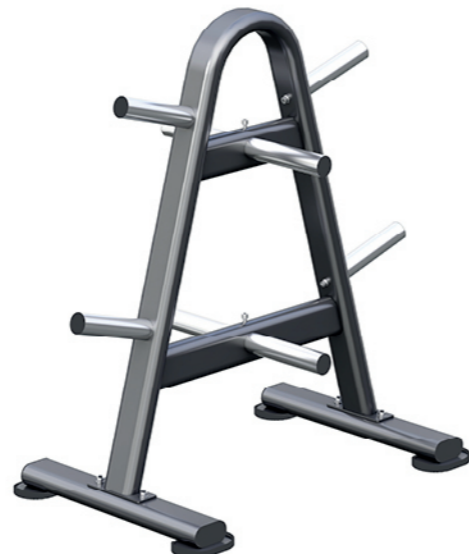
F-N62 杠铃架 Barbell Rack

占地面积 / Dimension: 1140X655X990mm 毛重 / 净重 G.W/N.W: 22kg/20kg