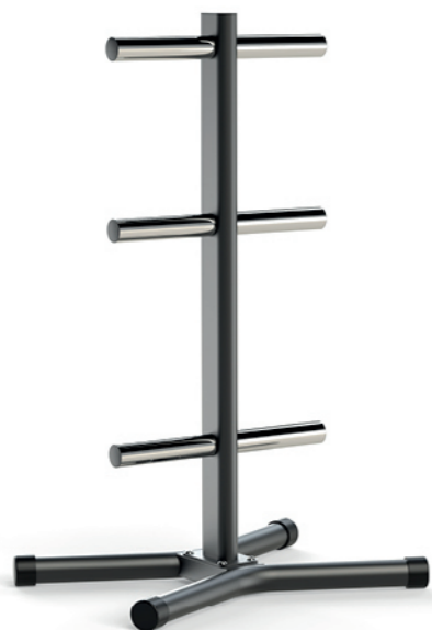
F-A63S 杠铃片架 Barbell Plate Tree

占地面积 / Dimension: 950×2000×2250mm 毛重 / 净重 G.W/N.W: 333kg/323kg