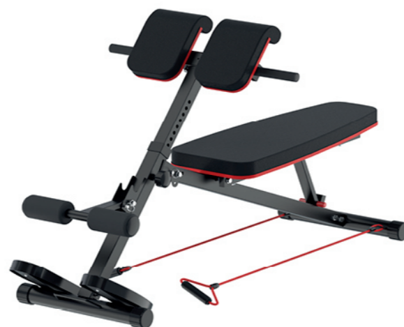
WT-B98 多功能罗马椅 Adjustable Roman Chair

占地面积 / Dimension: 1450×610×660mm 毛重 / 净重 G.W/N.W: 11kg/9kg