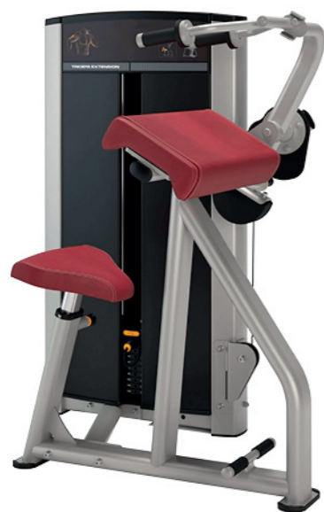
F18 三头肌伸展训练器 Triceps Extension

占地面积/Dimension: 1450x1040x1350mm 毛重/净重 G.W/N.W: 172kg/164kg