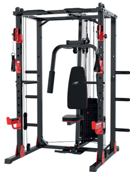
WT-H98 多功能深蹲训练器 Multi-functional Squat Machine 占地面积 / Dimension: 1850×1700×2150mm 毛重 / 净重 G.W/N.W: 210kg/194kg