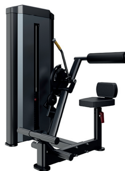
F-N09 坐姿腹背训练器 AB Crunch/Lower Back

占地面积/Dimension: 1100×1300×1550mm 毛重/净重 G.W/N.W: 177kg/169kg