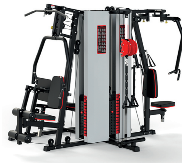
WT-H95C 五人站综合训练器 Multi Gym 5 Station 占地面积 / Dimension: 2400×2400×2050mm 毛重 / 净重 G.W/N.W: 395kg/385kg