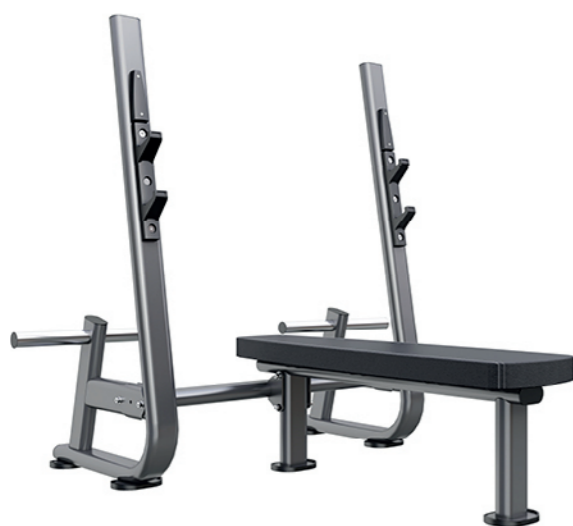
F-N52 水平举重床 Olympic Flat Weight Bench

占地面积 / Dimension: 980x780x780mm 毛重 / 净重 G.W/N.W: 30kg/27kg