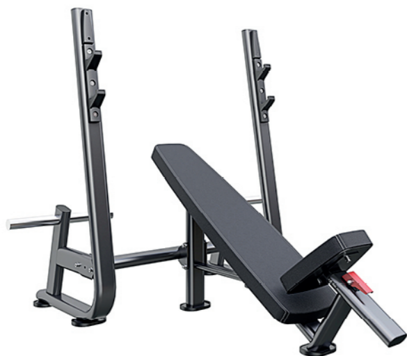
F-N50 上斜举重床 Incline Weight Bench

占地面积 / Dimension: 1700x1580x1460mm 毛重 / 净重 G.W/N.W: 65kg/62kg