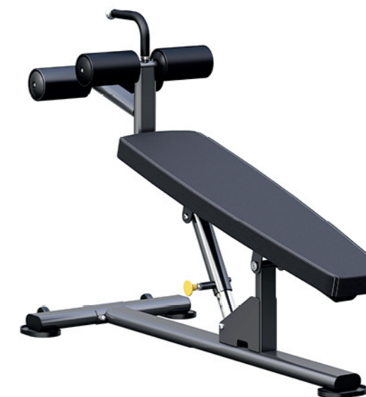
F-N56 可调腹肌板 Adjustable AB Bench

占地面积 / Dimension: 1140x800x930mm 毛重 / 净重 G.W/N.W: 30kg/27kg