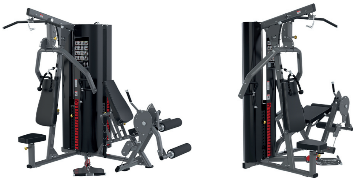
F-G3 三人站综合训练器 Multi Gym 3 Station

占地面积 / Dimension: 2260 × 1620 × 2160mm 毛重 / 净重 G.W/N.W: 336kg/320kg