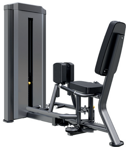
F-N13 大腿内外侧训练器 Outer/Inner Thigh Adductor

占地面积/Dimension: 1650X1600X1550mm 毛重/净重 G.W/N.W: 186kg/176kg