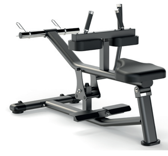
F-A60S 坐姿小腿训练器 Seated Calf Raise

占地面积 / Dimension: 1130×860×950mm 毛重 / 净重 G.W/N.W: 33kg/31kg