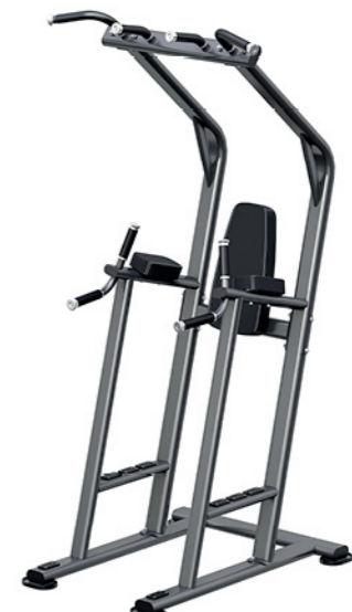
F-N66 单杠提膝训练器 Vertical Knee Raise Station

占地面积 / Dimension: 1340X655X1010mm 毛重 / 净重 G.W/N.W: 36kg/34kg