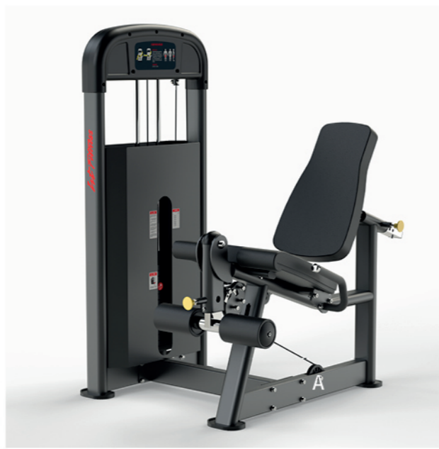
F-A02S 大腿伸展训练器 Leg Extension

占地面积/Dimension: 2080X1440X2300MM 毛重/净重 G.W/N.W: 183kg/176kg