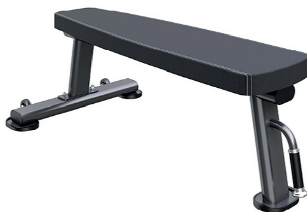
F-N53 平板凳 Flat Bench

占地面积 / Dimension: 1550x1580x1290mm 毛重 / 净重 G.W/N.W: 56kg/53kg