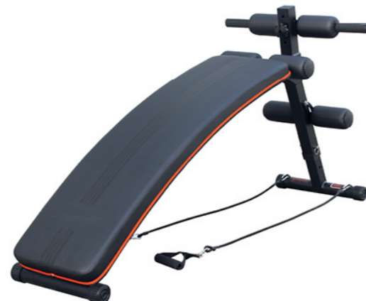
WT-B18C 豪华腹肌板 Sit Up Bench

占地面积 / Dimension: 1580×410×780mm 毛重 / 净重 G.W/N.W: 13kg/11kg