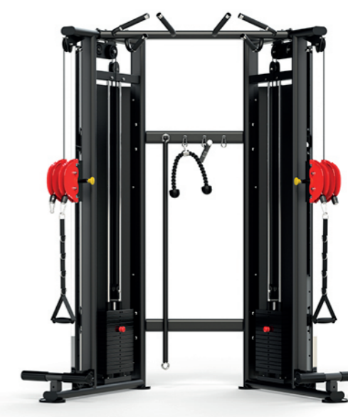
F-A88S 小飞鸟训练器 Multi Function Trainer

占地面积 / Dimension: 1865×1540×1730mm 毛重 / 净重 G.W/N.W: 113kg/109kg