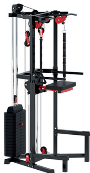
WT-K3 助力引体向上训练器 Chin Dip Assist

占地面积 / Dimension: 2000×1060×2200mm 毛重 / 净重 G.W/N.W: 52kg/49kg