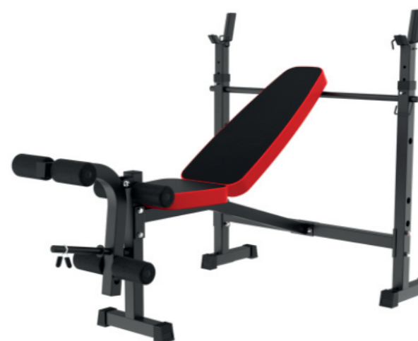
WT-B58A 举重床 Weight Bench

占地面积 / Dimension: 1780×1030×2080mm 毛重 / 净重 G.W/N.W: 134kg/130kg