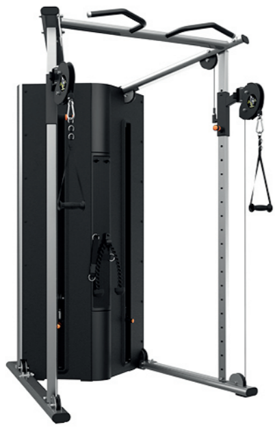
F88 可调式双滑轮多功能训练器 Dual Adjustable Functional Trainer

占地面积 / Dimension: 1400x1420x2200mm 毛重 / 净重 G.W/N.W: 326kg/316kg