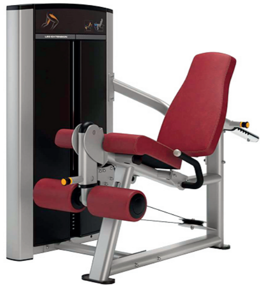
F02 腿部伸展训练器 Leg Extension

占地面积 / Dimension: 1780x1170x1350mm 毛重 / 净重 G.W/N.W: 273kg/265kg