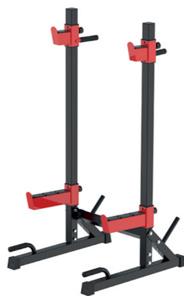
WT-B08A 深蹲架 Squat Rack

占地面积 / Dimension: 1180×560×1330mm 毛重 / 净重 G.W/N.W: 19kg/18kg