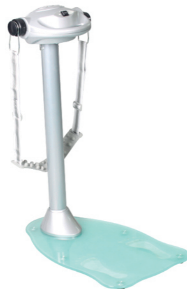
WT-D58 美姿机 Massager

占地面积 / Dimension: 1216×1110×2070mm 毛重 / 净重 G.W/N.W: 123kg/119kg