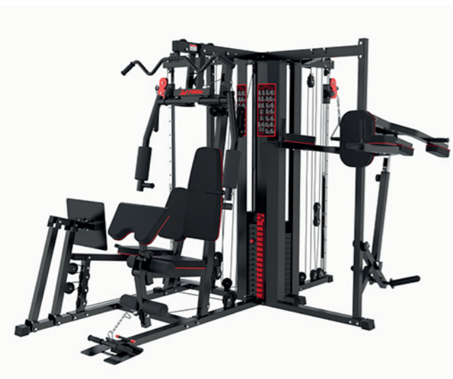
WT-H80A 八人站综合训练器 Multi Gym 8 Station 占地面积 / Dimension: 2900×2500×2050mm 毛重 / 净重 G.W/N.W: 330kg/317kg