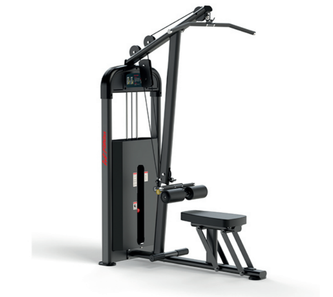
F-A19S 高低拉训练器 Lat Pulldown/Low Row

占地面积/Dimension: 1210×1340×1980mm 毛重/净重 G.W/N.W: 159kg/152kg