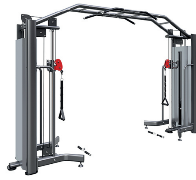
F-N06 大飞鸟训练器 Cable Crossover

占地面积/Dimension: 980×1370×1550mm 毛重/净重 G.W/N.W: 176kg/168kg