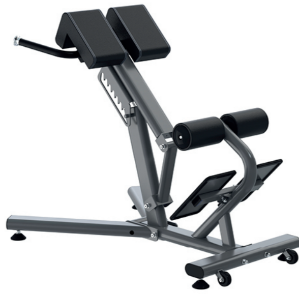
F-N59 罗马椅 Roman Chair

占地面积 / Dimension: 1450X660X1320mm 毛重 / 净重 G.W/N.W: 32kg/29kg