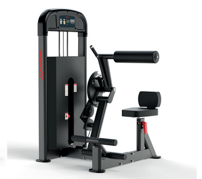
F-A09S 坐姿腹背训练器 AB Crunch/Lower Back

占地面积/Dimension: 1080×1380×1526mm 毛重/净重 G.W/N.W: 150kg/141kg