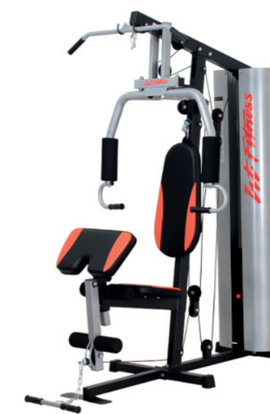
WT-H68 单人站综合训练器 Home Gym 1 Station

占地面积 / Dimension: 1520×995×2020mm 毛重 / 净重 G.W/N.W: 89kg/85kg