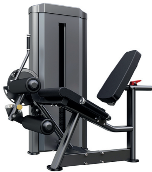
F-N02 大腿伸展训练器 Leg Extension/Leg Curl

占地面积/Dimension: 1750X2080X2280mm 毛重/净重 G.W/N.W: 203kg/194kg