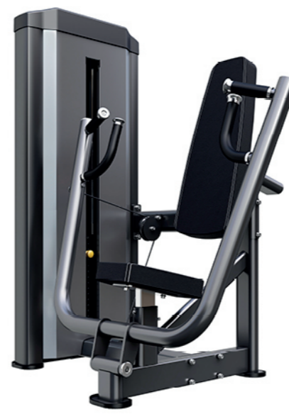
F-N05 坐式推胸训练器 Seated Chest Press

占地面积/Dimension: 1500x1160x1550mm 毛重/净重 G.W/N.W: 185kg/178kg