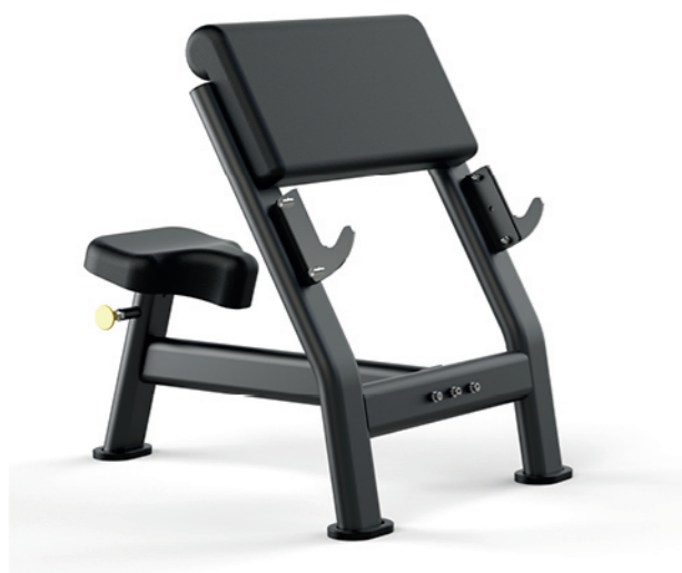
F-A55S 二头肌架 Scott Bench

占地面积 / Dimension: 1440×1270×2330mm 毛重 / 净重 G.W/N.W: 110kg/107kg