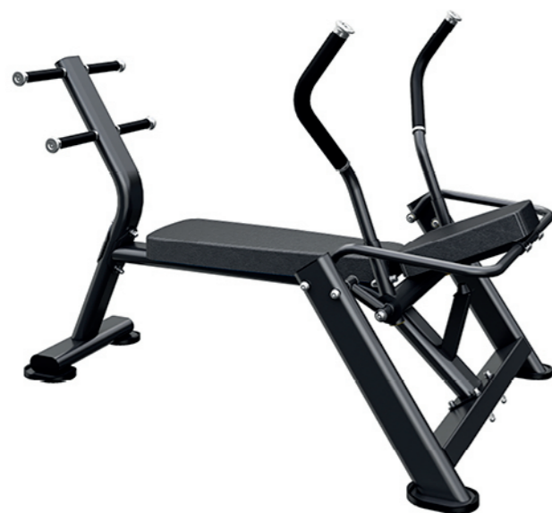
F-N68 卷腹训练器 AB Crunch Machine

占地面积 / Dimension: 1450X950X1060mm 毛重 / 净重 G.W/N.W: 48kg/45kg