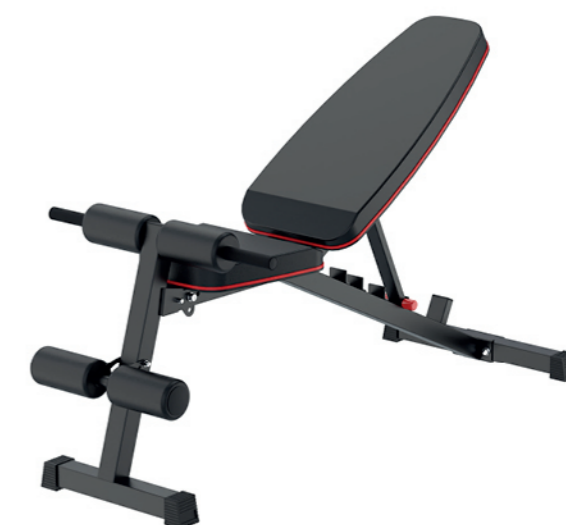
WT-B09 多功能小飞鸟 Adjustable Dumbbell Bench

占地面积 / Dimension: 1420×570×1250mm 毛重 / 净重 G.W/N.W: 25kg/23kg