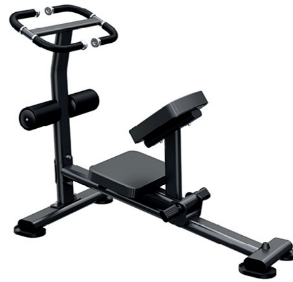
F-N65 拉筋训练器 Stretching Machine

占地面积 / Dimension: 980X780X1470mm 毛重 / 净重 G.W/N.W: 51kg/49kg