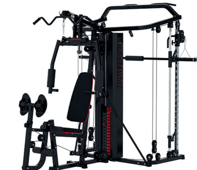
WT-H75 多功能综合训练器 Multi Function Trainer

占地面积 / Dimension: 1790 × 1100 × 2050mm 毛重 / 净重 G.W/N.W: 211kg/201kg