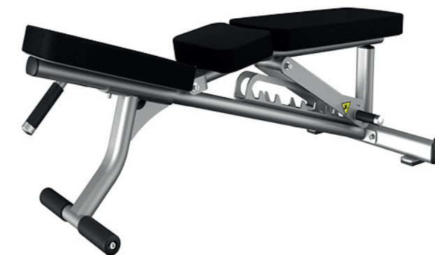
F57 可调式哑铃训练椅 Adjustable Bench

占地面积/Dimension: 1850x730x1040mm 毛重/净重 G.W/N.W: 80kg/76kg