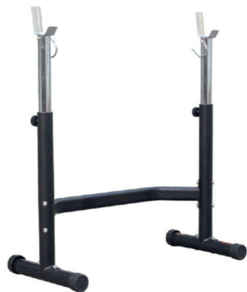
WT-B08 深蹲架 Squat Rack

占地面积 / Dimension: 1180×560×1330mm 毛重 / 净重 G.W/N.W: 19kg/18kg