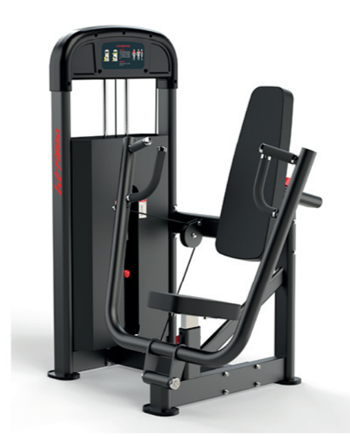
F-A05S 坐式推胸训练器 Seated Chest Press

占地面积/Dimension: 1160x1370x1526mm 毛重/净重 G.W/N.W: 153kg/145kg