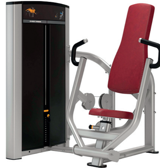
F05 胸部推举训练器 Chest Press

占地面积 / Dimension: 1600x1020x1350mm 毛重 / 净重 G.W/N.W: 204kg/196kg