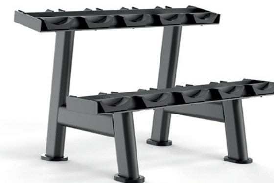
F-A54A 五付哑铃架 Dumbbell Rack(5 Pairs)

占地面积/Dimension: 1310×650×445mm 毛重/净重 G.W/N.W: 19kg/17kg