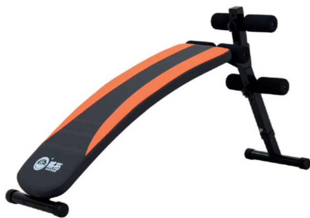
WT-B18B 豪华腹肌板 Sit Up Bench

占地面积 / Dimension: 1580×410×780mm 毛重 / 净重 G.W/N.W: 13kg/11kg