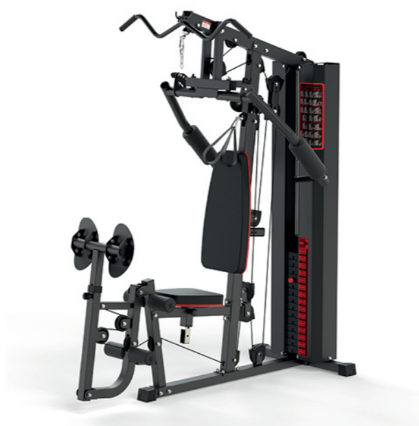
WT-H18D 单人站综合训练器 Home Gym 1 Station

占地面积 / Dimension: 1780×1030×2080mm 毛重 / 净重 G.W/N.W: 132kg/128kg