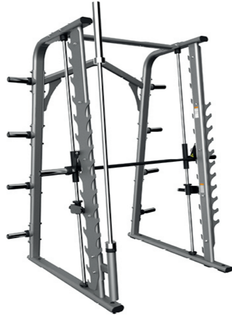
F01 史密斯训练器 Smith Machine

占地面积 / Dimension: 1400x1420x2200mm 毛重 / 净重 G.W/N.W: 326kg/316kg