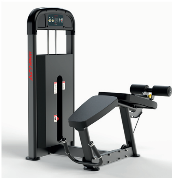
F-A03S 卧式屈腿训练器 Prone Leg Curl

占地面积/Dimension: 3770×950×2260mm 毛重/净重 G.W/N.W: 279kg/269kg