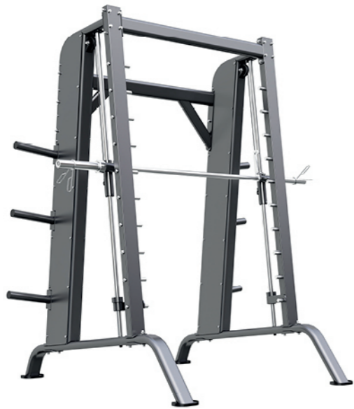
F-N01 史密斯训练机 Smith Machine

占地面积/Dimension: 1750X2080X2280mm 毛重/净重 G.W/N.W: 203kg/194kg