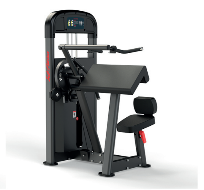
F-A16S 上臂屈伸训练器 Biceps Curl/Triceps Press

占地面积/Dimension: 1760×1150×1765mm 毛重/净重 G.W/N.W: 177kg/170kg