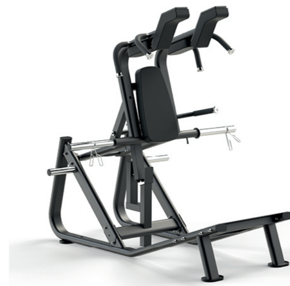
F-A69S 哈克深蹲训练器 Hack Squat Machine

占地面积 / Dimension: 980×780×1470mm 毛重 / 净重 G.W/N.W: 51kg/49kg