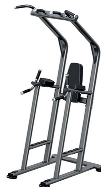
F66 单杠提膝训练器 Vertical Knee Raise Station

占地面积/Dimension: 1650x1020x1350mm 毛重/净重 G.W/N.W: 208kg/200kg