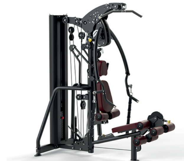
WT-S2 单站综合训练器 Home Gym 1 Station

占地面积 / Dimension: 3000 × 2250 × 2160mm 毛重 / 净重 G.W/N.W: 633kg/615kg