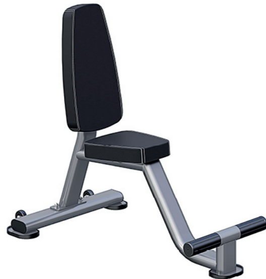
F-N61 推肩椅 Utility Bench

占地面积 / Dimension: 1980X1165X1230mm 毛重 / 净重 G.W/N.W: 60kg/56kg