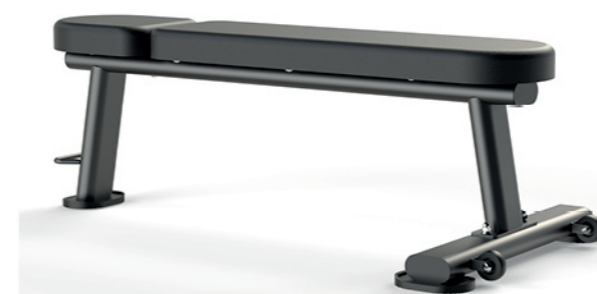
F-A53S 平板凳 Flat Bench

占地面积/Dimension: 1720×1580×1430mm 毛重/净重 G.W/N.W: 60kg/57kg