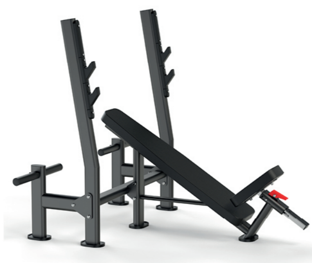
F-A50S 上斜推举重床 Incline Weight Bench

占地面积/Dimension: 2300×1600×1400mm 毛重/净重 G.W/N.W: 124kg/117kg