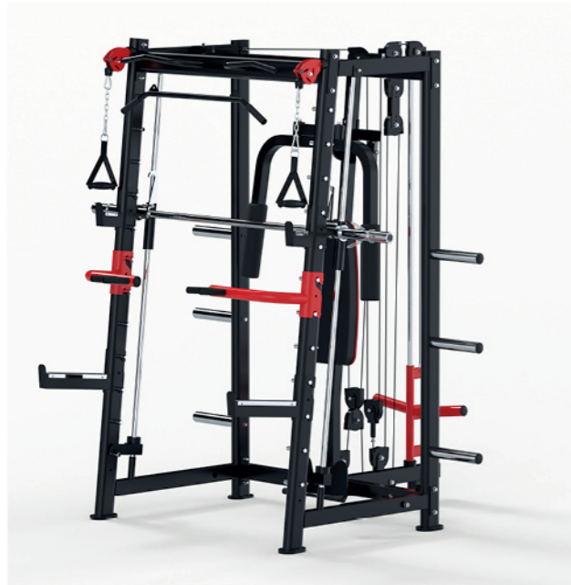
F-A98 多功能史密斯训练器 Multi-functional Smith Machine 占地面积 / Dimension: 1900×2200×2200mm 毛重 / 净重 G.W/N.W: 179kg/170kg