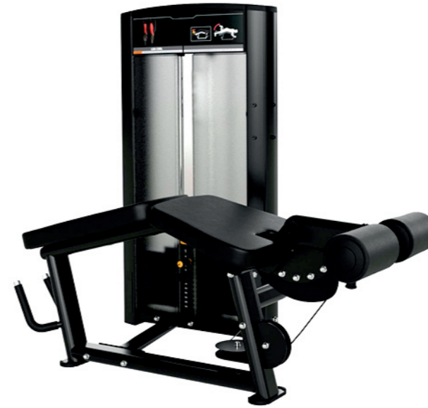
F03 卧式屈腿训练器 Prone Leg Curl

占地面积 / Dimension: 1420X1850X2230mm 毛重 / 净重 G.W/N.W: 180kg/171kg