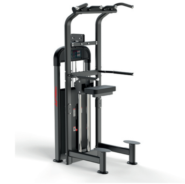
F-A14S 上肢屈伸训练器 Chin Dip Assist

占地面积/Dimension: 1600×1700×1526mm 毛重/净重 G.W/N.W: 151kg/143kg