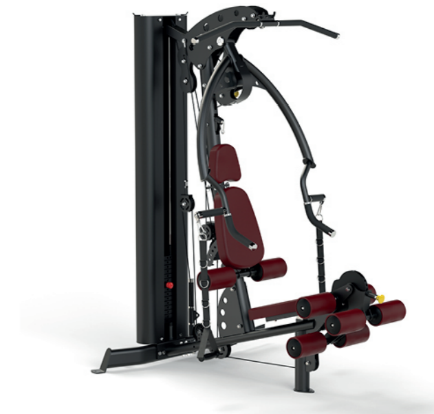
WT-S1 单站综合训练器 Home Gym 1 Station

占地面积 / Dimension: 2260 × 1070 × 390mm 毛重 / 净重 G.W/N.W: 408kg/358kg