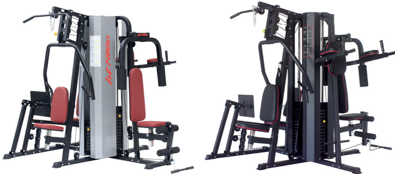
WT-H85/H85A 五人站综合训练器 Multi Gym 5 Station

占地面积 / Dimension: 2100×890×2060mm 毛重 / 净重 G.W/N.W: 160kg/154kg